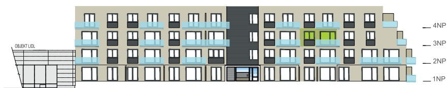
Východní pohled na dům / Building View - east side