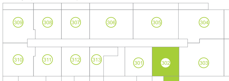
Půdorys podlaží / Floor plan